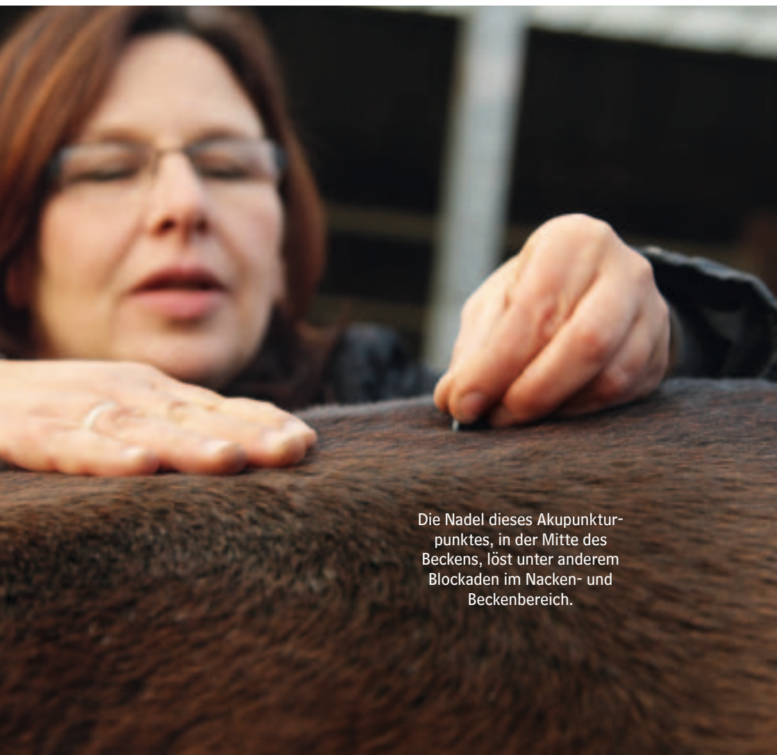
Die Nadel dieses Akupunkturpunktes, in der Mitte des Beckens, löst unter anderem Blockaden im Nacken- und Beckenbereich.